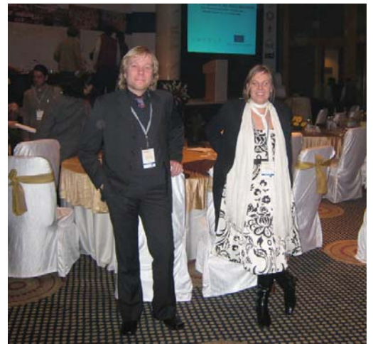
Under konferensen på The Grand fick vi användning för våra "överviktskläder". Vi har lyckats byta till oss en hel del visitkort, sovit på mer än ett föredrag, ätit upp oss ytterligare och eventuellt lärt oss ett och annat om hur svenska städer skulle kunna förnyas.

Det går att nå oss via epost: maria@mangoarkitekter.se och mikael@mangoarkitekter.se